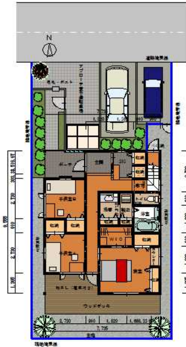
配置図兼1階平面図 1/100